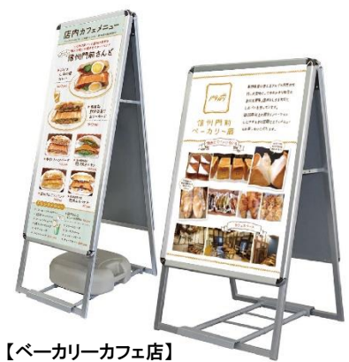
【ベーカリーカフェ店】 イートインテイクアウト案内